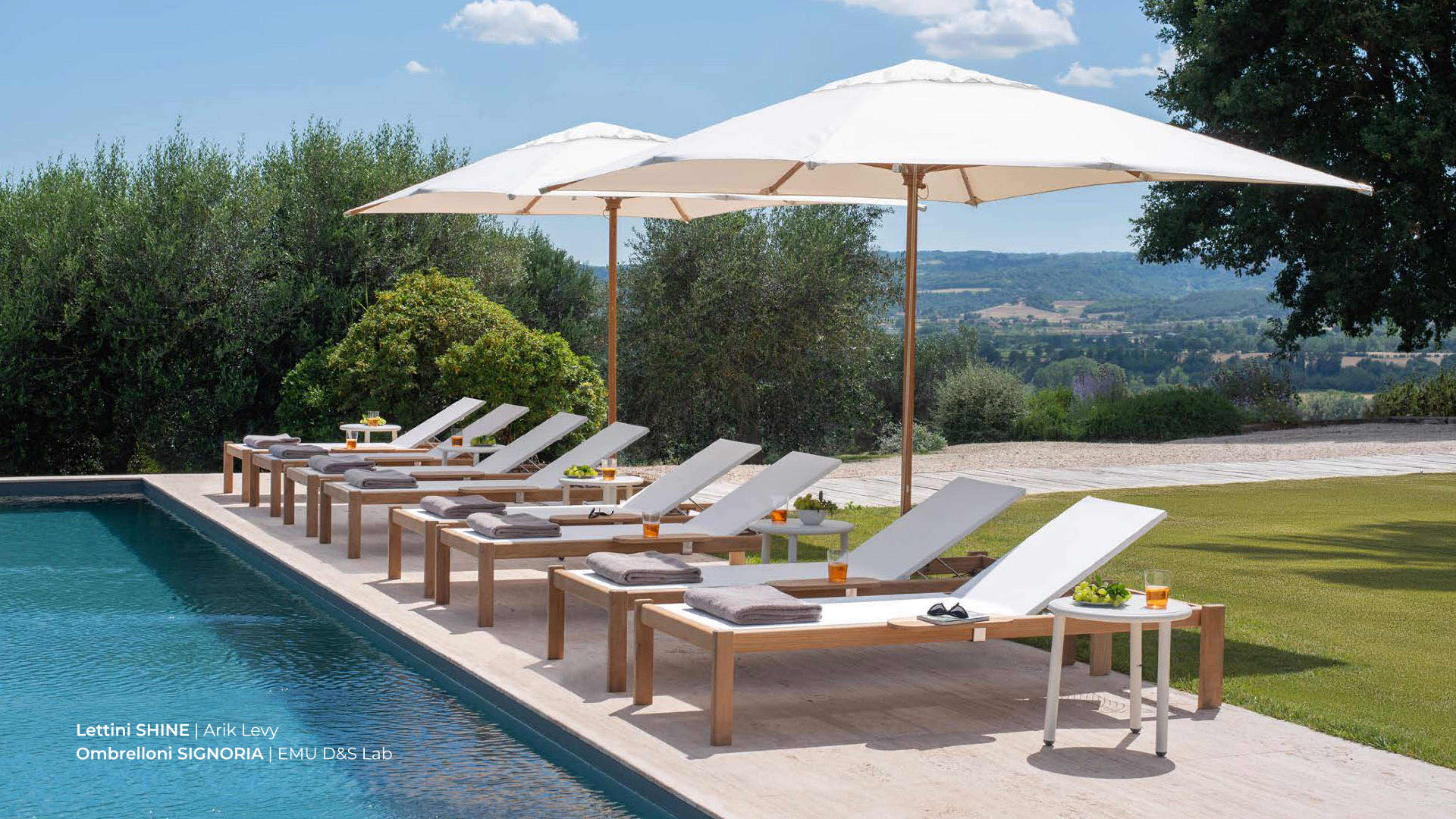
Lettini SHINE | Arik Levy Ombrelloni SIGNORIA | EMU D&S Lab