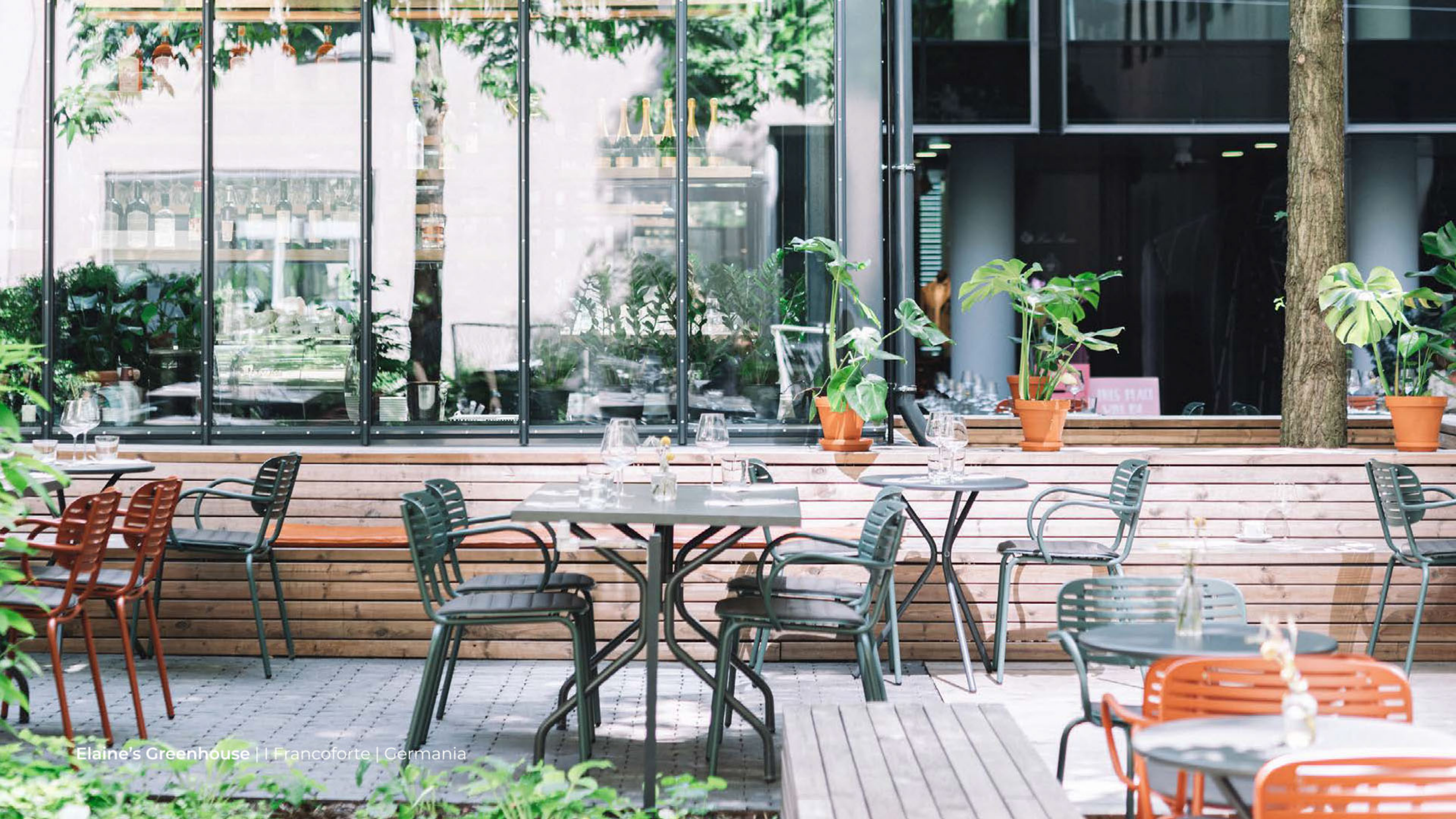
Elaine's Greenhouse | | Francoforte | Germania