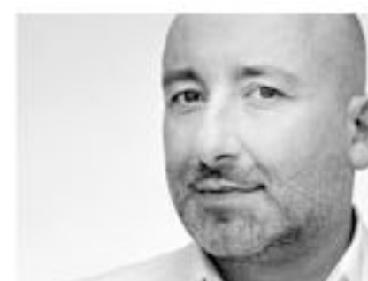
Jean Marie Massaud