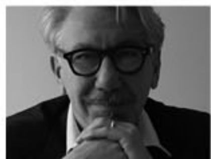
LCM Marin Design Studio