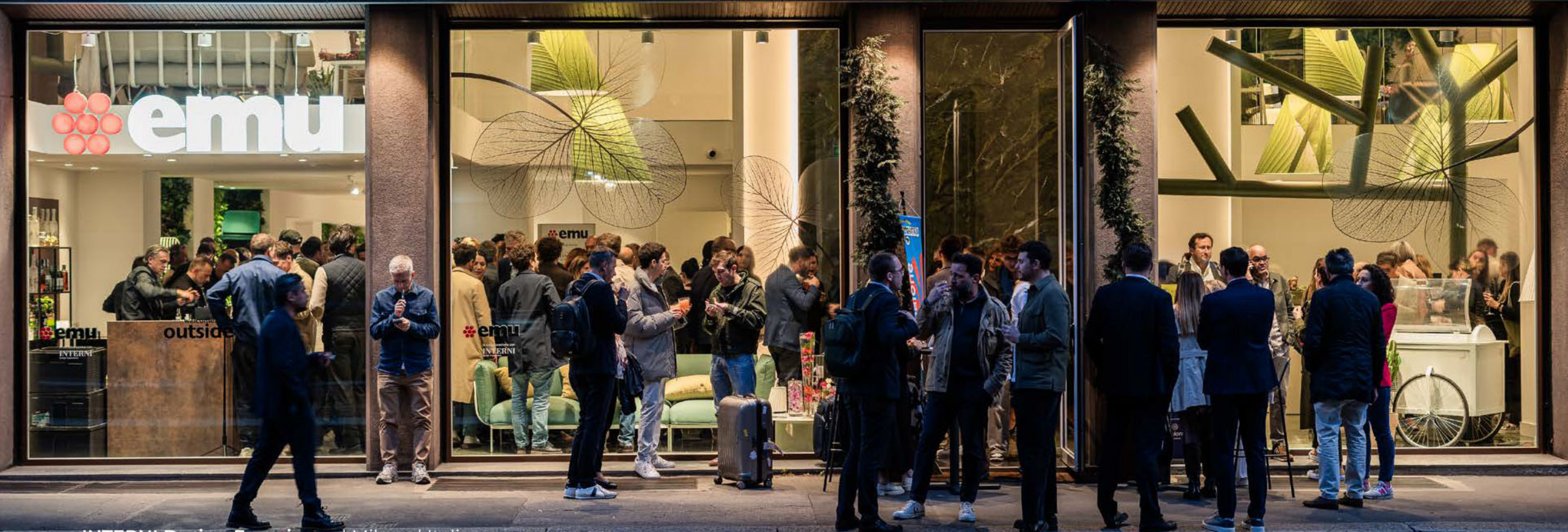
INTERNI Design Experience | Milano | Italia